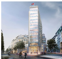
SPRINGER QUARTIER Hamburg