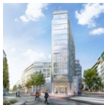
Springer Quartier Hamburg, 60.000 m 2 , Office, Retail