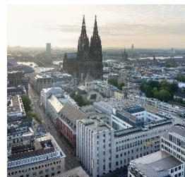
Deutsche Bank Campus Köln