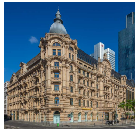
Fürstenhof Frankfurt am Main