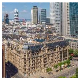
Fürstenhof Frankfurt am Main