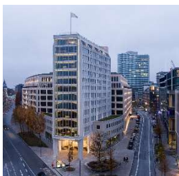
Springer Quartier Hamburg