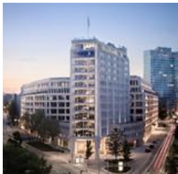
Springer Quartier Hamburg