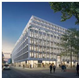
Trinkaus Karree Düsseldorf