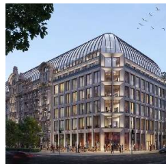
Fürstenhof Frankfurt am Main