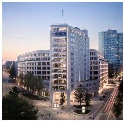
Springer Quartier Hamburg