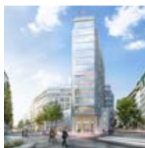
Springer Quartier Hamburg, 60.000 m 2 , Office, Retail