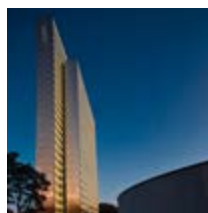
Dreischeibenhaus Düsseldorf, 35.000 m 2 , Highrise Office Building