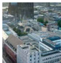
Deutsche Bank Areal Köln, 32.000 m 2 , Office