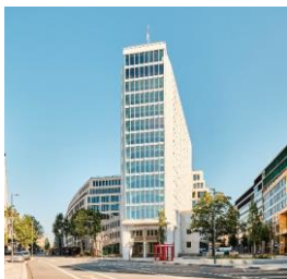
Springer Quartier Hamburg