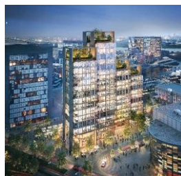
UNIQ Towers Düsseldorf