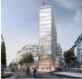
Springer Quartier Hamburg