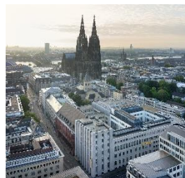
Deutsche Bank Campus Köln