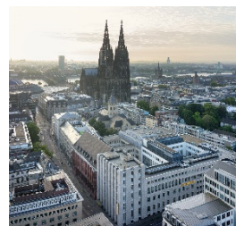
Deutsche Bank Campus Köln