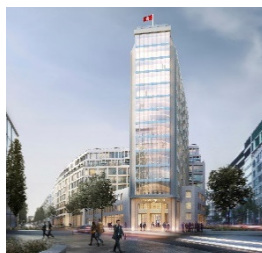
SPRINGER QUARTIER Hamburg